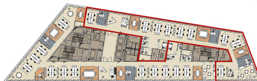
MAC7 - 1° Piano Esempio Lay-out multi-tenants