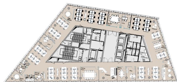
MAC7 - 8° Piano Esempio Lay-out single tenant