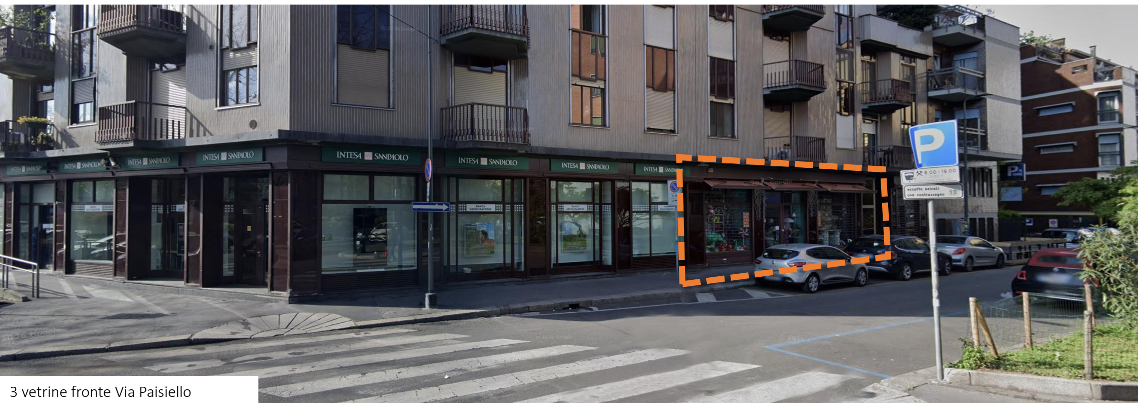
3 vetrine fronte Via Paisiello